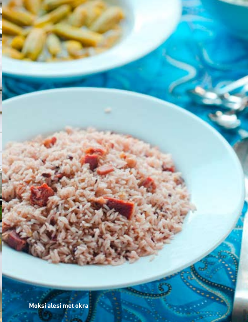
Moksi alesi met okra