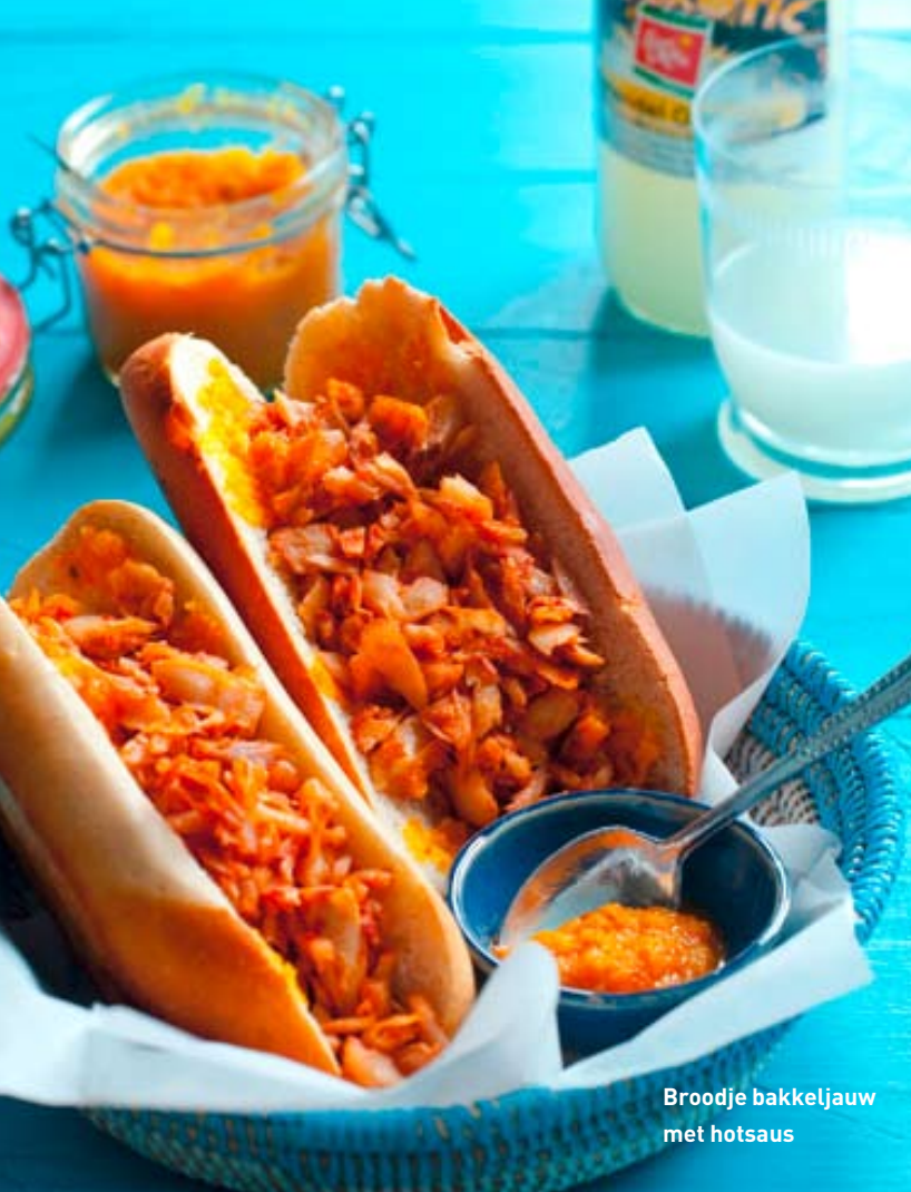
Broodje bakkeljauw met hotsaus